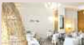
VERACE Via Passo Buole, 97/L Tel. 06.94376469