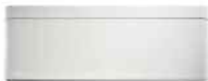
Stylish F15A AM

Il meglio di Stylish, il meglio del Design Design puro e super-compatto per personalizzare ogni ambiente