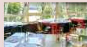
VELA E CUCINA Via Monte Cadria, 72 Tel. 328.1735665

ALLA PASSERELLA Via Torre Clementina, 158 Tel. 06.65047741