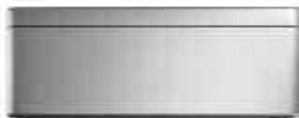
Stylish F15A AL