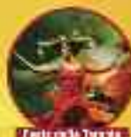
Festa della Tarantella