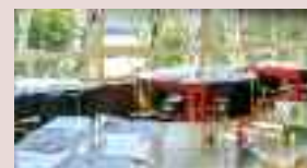
VELA E CUCINA Via Monte Cadria, 72 Tel. 328.1735665

AL CASTELLO Via della Scafa, 474 Tel. 348.1429135