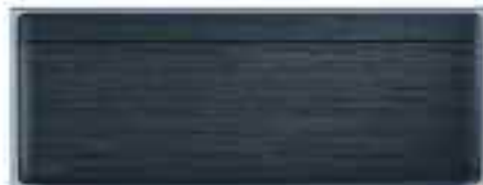
Stylish F125 AL