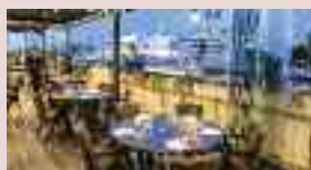
CIELO FCO Via Torre Clementina, 154 Tel. 06.6506368